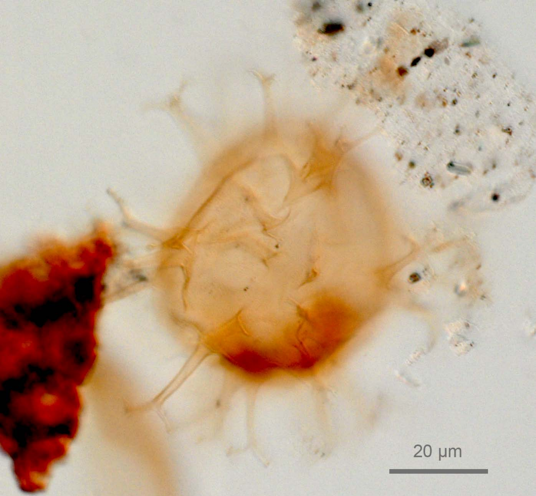
Spiniferites firmus Matsuoka 1983 : holotype