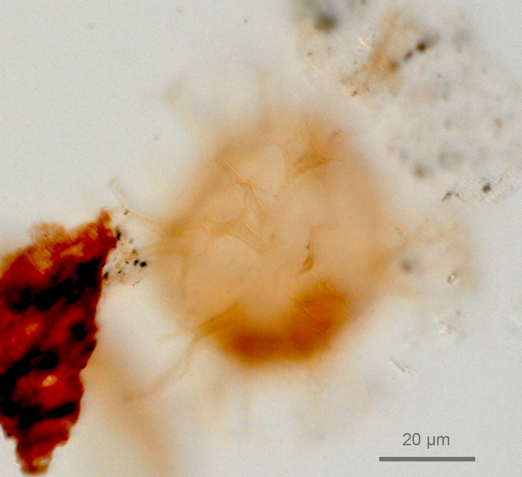
Spiniferites firmus Matsuoka 1983 : holotype